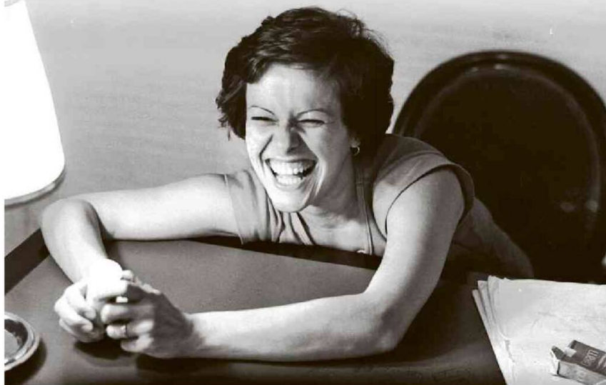
BANCO DE DADOS, 15/11/1977

Com isso, a Capital passará a ter dois espaços dedicados a ela, ambos com acesso gratuito. A intenção é de que o novo local seja aberto ao público durante as celebrações relacionadas ao Dia Estadual do Patrimônio Cultural 2023, com atividades de 19 a 20 de agosto.